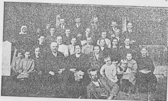
Egy kis jugoszláviai gyülekezet. (Szövegét lásd a 9. oldalon.)

A kárhozott a nemgyakorlókéra. Vers 41:46. — Csupán a hit nem emel cselekedet nélkül az Isten országának tökéletességébe! Az Isten a madaraknak két-két szárnyat te-