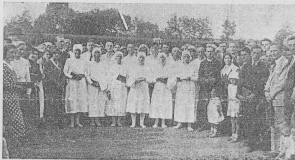
A rákoskeresztúri bemeitözök képe. (Cikk a 10. oldalon.)

Testvéreim! Igyekezzünk tökéletesen járni az Úr előtt. Tekint- sük meg Lótnak feleségét, akinek